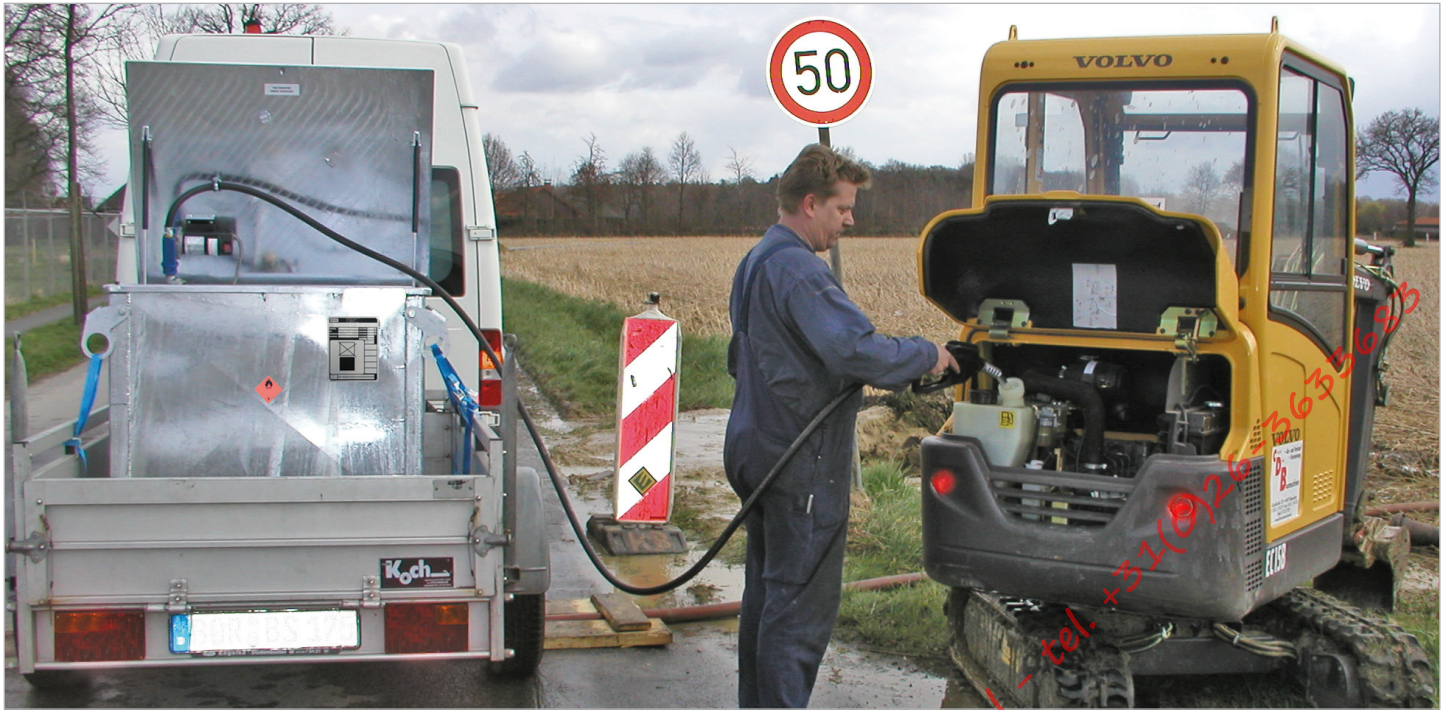
Type MT 450 met elektropomp