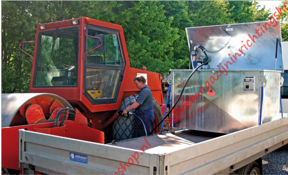
Type MT 1000 met elektropomp

Mobiel tank voor de verzorging van voertuigen, bouw-/werkmachines, apparaten, aggregaten etc. met diesel of stookolie. Internationaal vervoer van gevaarlijke vloeibare stoffen volgens ADR/RID/IMDG-code, verpakkingsgroepen II en III