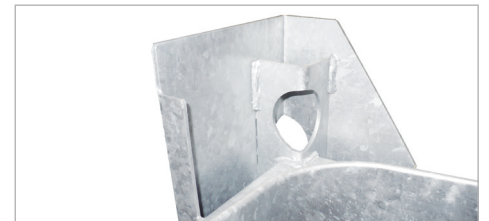
Kraanogen aan de binnenzijde van de stapelhoek