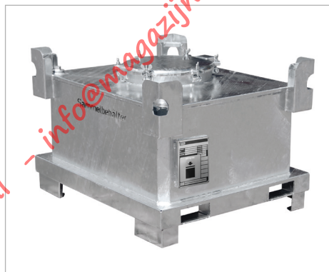
Type SAF 450