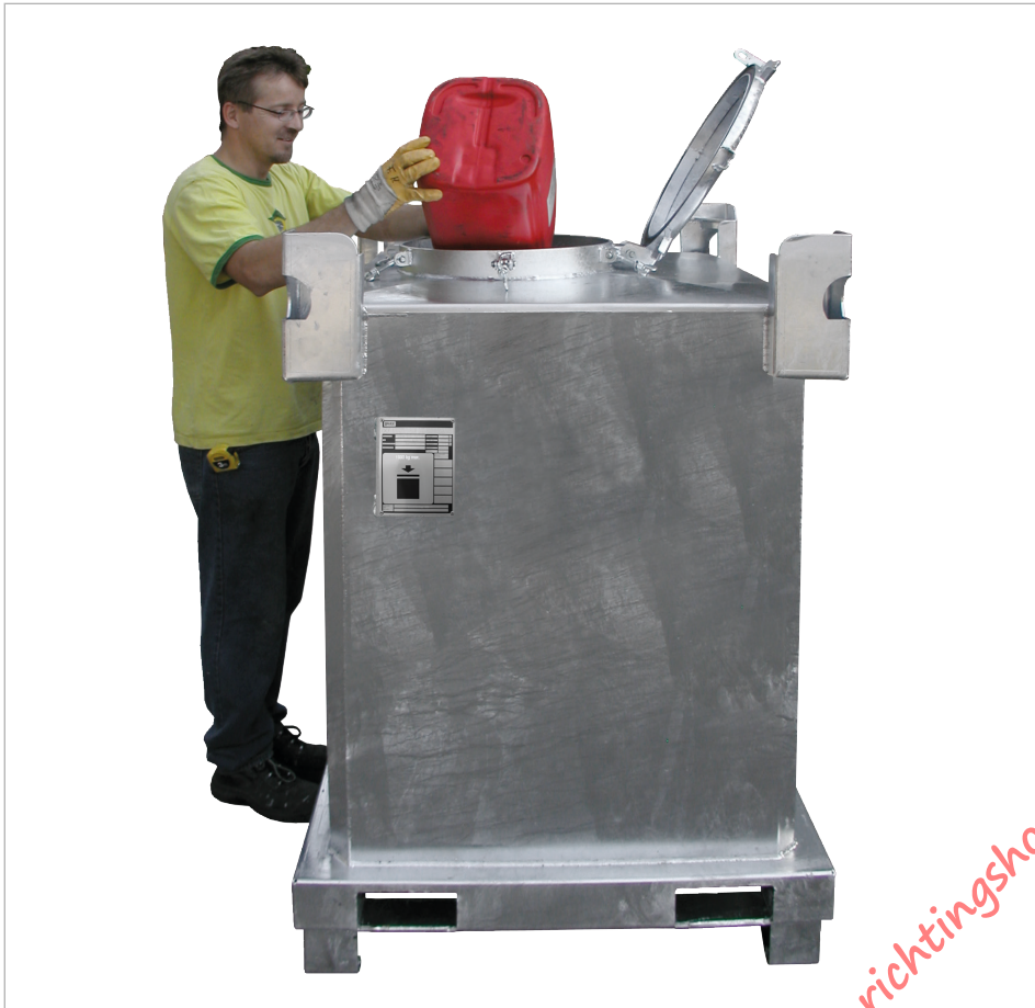
Type SAF 1000

Internationaal vervoer van gevaarlijke vloeibare stoffen volgens ADR/RID/IMDG-code, verpakkingsgroepen II en III