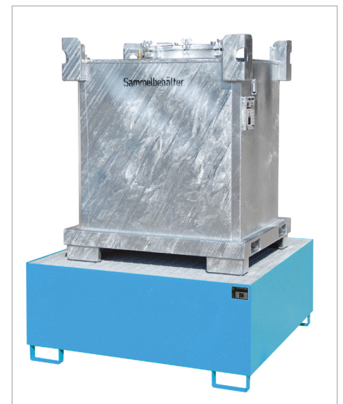
Type SAF met opvangbak type AW 1000 (zie pagina 87)