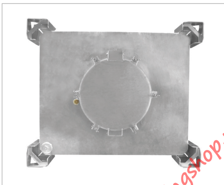
Koepeldeksel in het midden