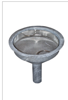
Trechter met zeef van roestvrij staal