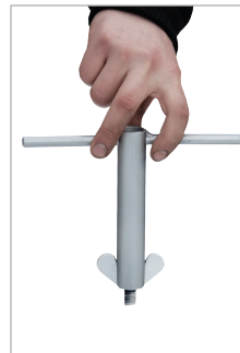
Sleutel voor vleugelmoeren