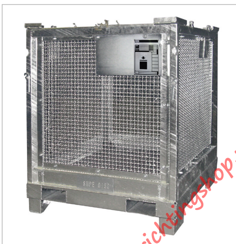
Type STB 1000