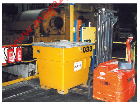
Mobiele aanvoer voor machines