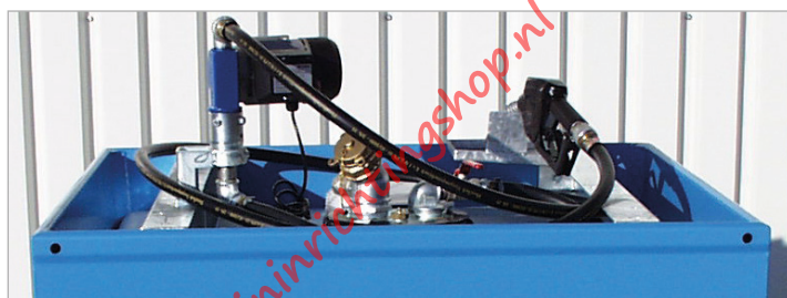
Type M 800 met electropomp