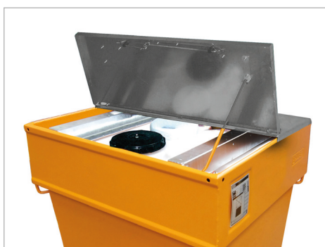
Type M 800 met deksel