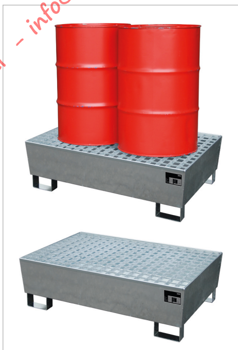
Type ECO-S 2/200