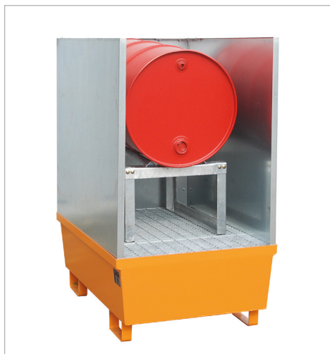
Type AS-G 1