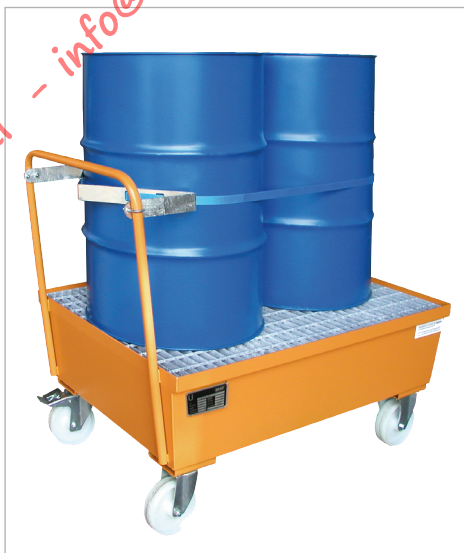
Type AW-F 2 met houder en spangordel