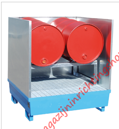
Type AS-G 2