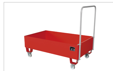
Opvangbak met module 2