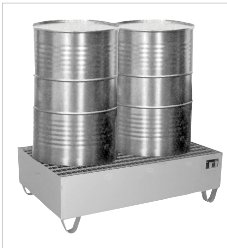
Type VAW-2 met rooster

Opslag van max. 4 vaten à 200 liter of max. 2 containers (IBC) à 1000 liter met agressieve stoffen, ook met 60 liter vaten en kleine blikken combineerbaar