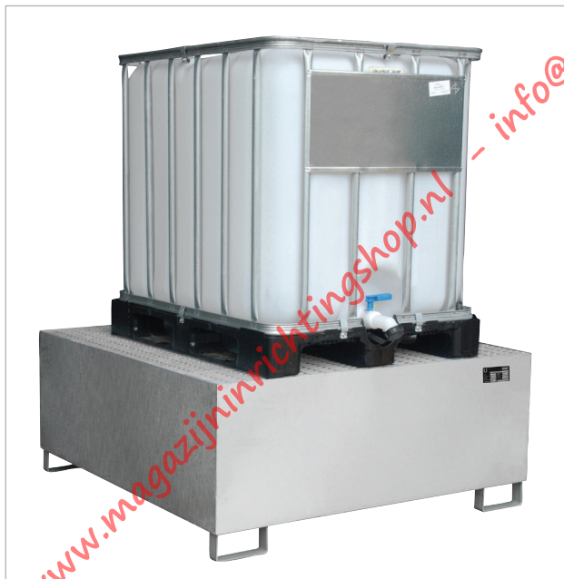
Type VAW-1000 met rooster