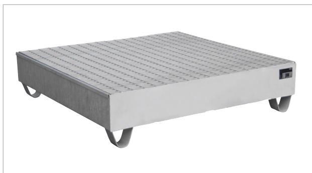
Type VAW-4/A met rooster