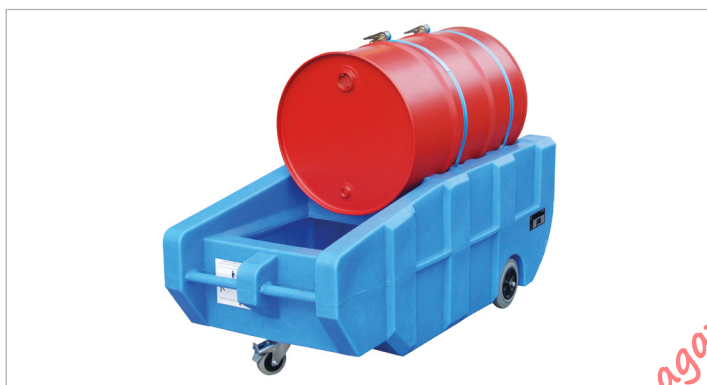
Type WPT 230