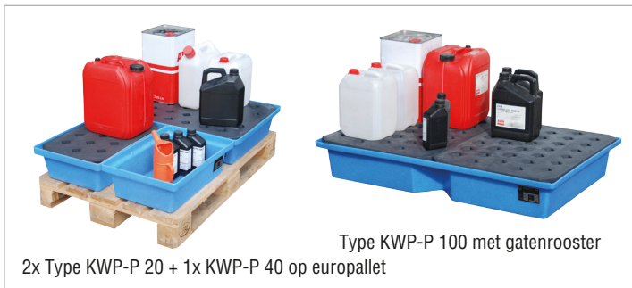
2x Type KWP-P 20 + 1x KWP-P 40 op europallet Type KWP-P 100 met gatenrooster