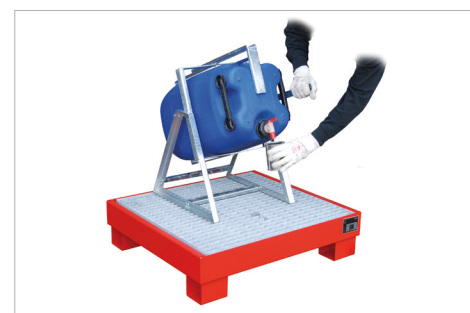
Jerrycan schenkulp Type KAH-60 (zie pagina 107) met opvangbak type AW 60-2/M (zie pagina 78)