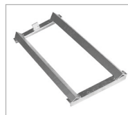
Type FA 60-A