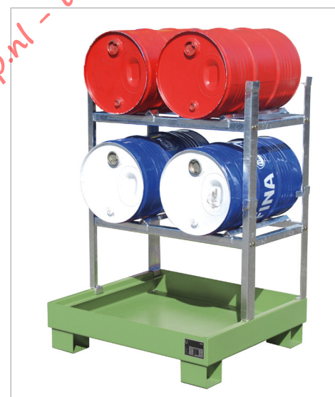
Type AW 60-2 + 2xAG 60-2 + 4xFA 60-A