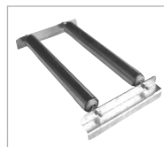
Type RA 60-A