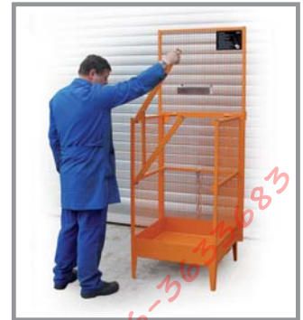
Arbeitsbühne für 1 Person