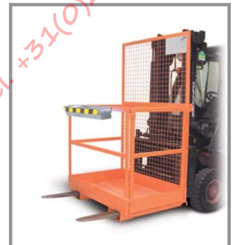
Arbeitsbühne, quer aufzunehmen