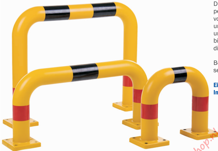
Abm. Grundplatte 140 x 140 x 20 mm

Die Rammschutzbügel sind die perfekte Lösung zum Schutz von Gebäudeteilen, Maschinen und Inventar. Die unterschiedlichen Größen bieten für jeden Einsatzzweck die richtige Lösung.