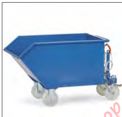
Kiepbak uitgevoerd met wielen

Achteraf uit te rusten. Met zeef voor het afscheiden van vaste en vloeibare stoffen.