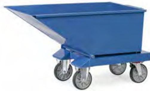
4701 | 4701/7016