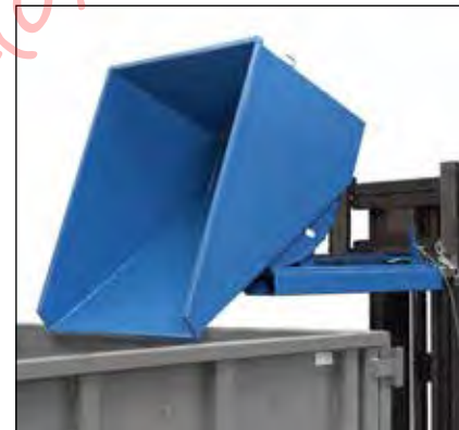
Kantelbak met vorkheftruck