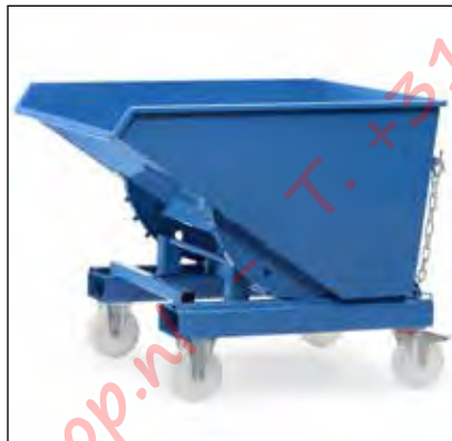
Kantelbak uitgevoerd met wielen

Achteraf uit te rusten. Met zeef voor het afscheiden van vaste en vloeibare stoffen.