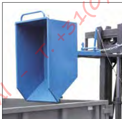
Kiepbak met vorkheftruck