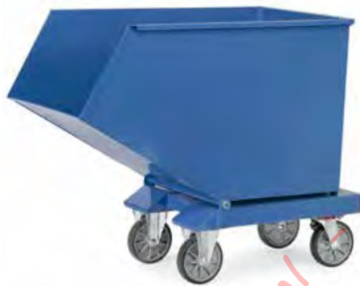
4702 | 4702/7016 | 4703 | 4703/7016 | 4704 | 4704/7016