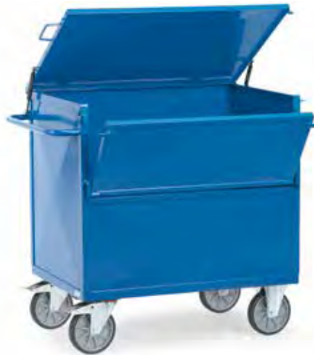
2862 | 2863 Bakwagens met deksel