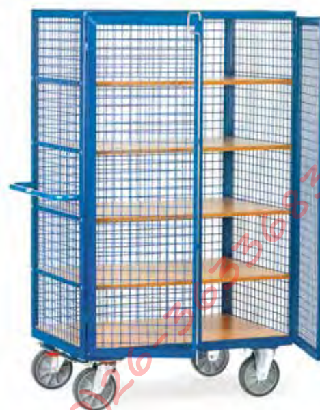
4392 | 4393 Stangsluiting