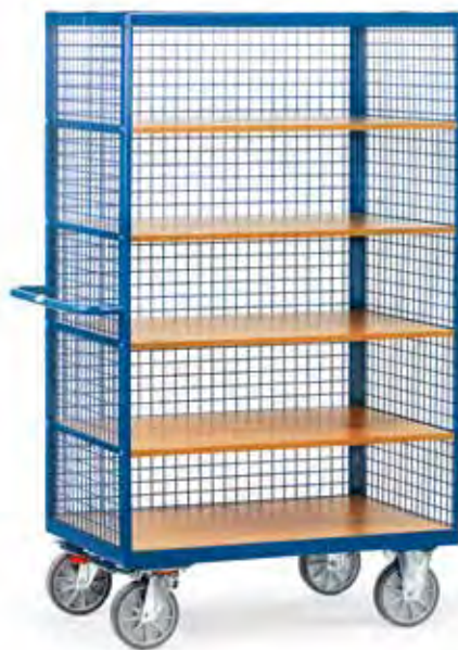
3392 | 3393