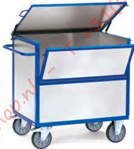
2832 | 2833 Bakwagens met deksel