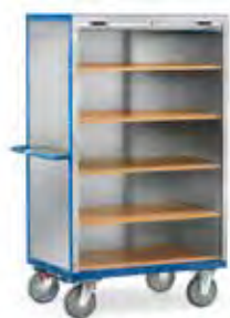
5692 | 5693 Geopend