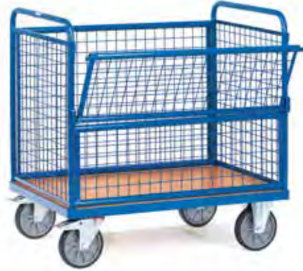
2772 | 2773 Gaaswandwagens