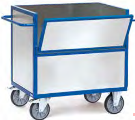
2822 | 2823 Bakwagens