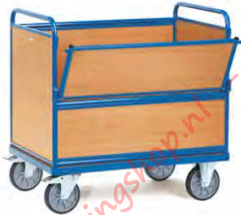
2872 | 2873 Bakwagens