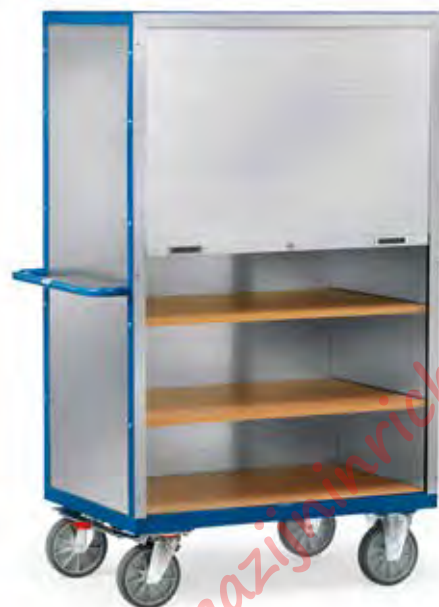
5692 | 5693