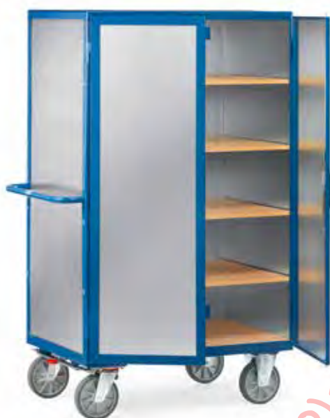
5592 | 5593 Aluminium plaat