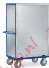
5692 | 5693 Gesloten