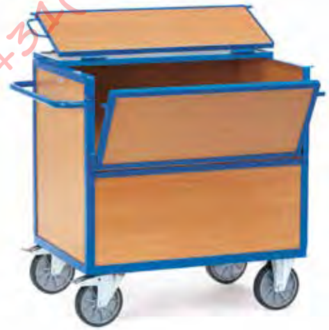
2852 | 2853 Bakwagens met deksel