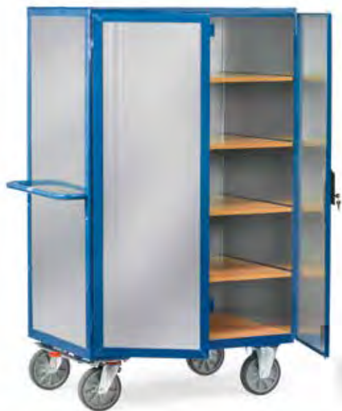
5492 | 5493 Verzinkte staalplaat