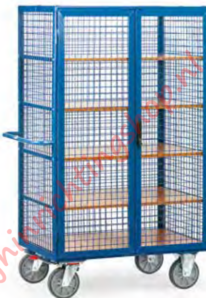
5392 | 5393 Spanjoetsluiting