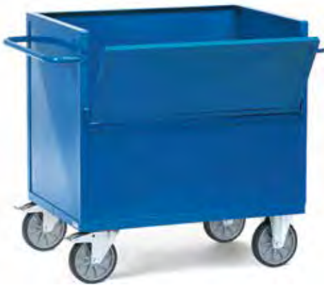
2842 | 2843 Bakwagens

Als 2822 | 2823, echter met een ééndelige deksel zoals bij 2862 | 2863. Afsluitbaar met een hangslot.