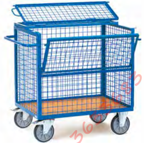
2762 | 2763 Gaaswandwagens met deksel