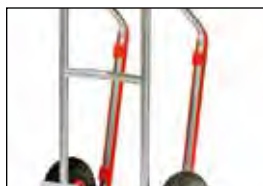
Kunststof glijstrippen 1753 1 Set compleet met bevestigingsmateriaal

Aluminium steekwagens met zuiver gelaste aluminium schep, zeer licht en handzaam. Zuiver gelast en onbehandeld, aluminium schep aanschroefbaar en daardoor omwisselbaar. Luchtbanden op kunststof velg, naaf met rollager. Beugel boven en dwarsverbinding gebogen. Voor het veilig transporteren van ronde goederen zoals rollen, kannen, emmers enz. Ongemonteerde aanlevering. Naar wens met massief rubber banden. Zonder meerprijs leverbaar. A.u.b. bij het bestelnr. van de steekwagen de „L” door een „V” vervangen.