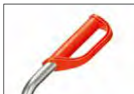
Handvat 1762 met veiligheidsbeugel voor buis Ø 27 mm.